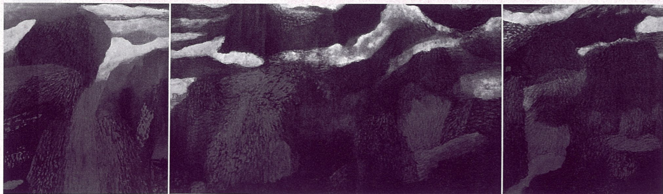
《红色山梦》 王兴堂 中国画 50 × 200cm