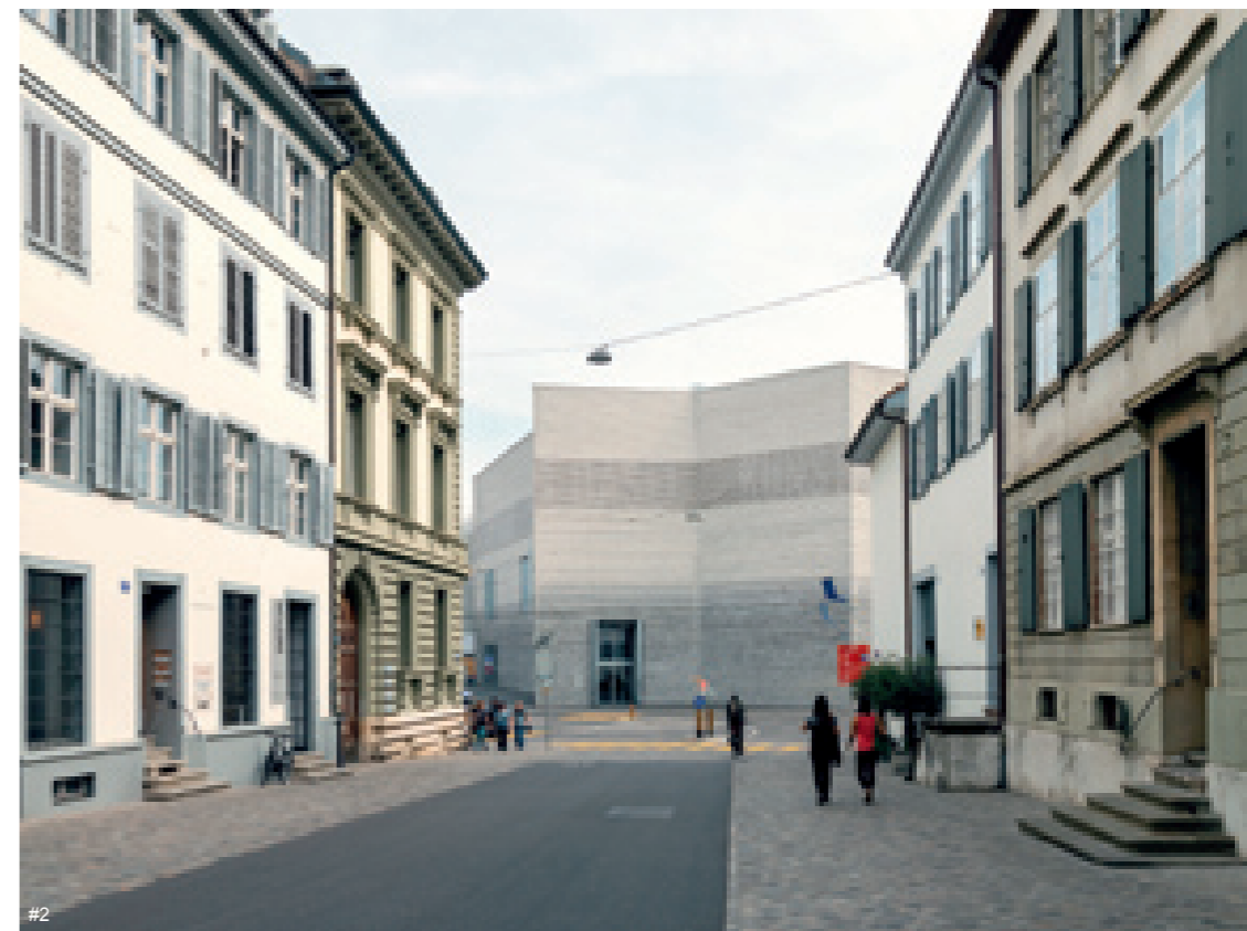
1-2 巴塞尔美术馆外观

Keywords: art museum, collection, architecture