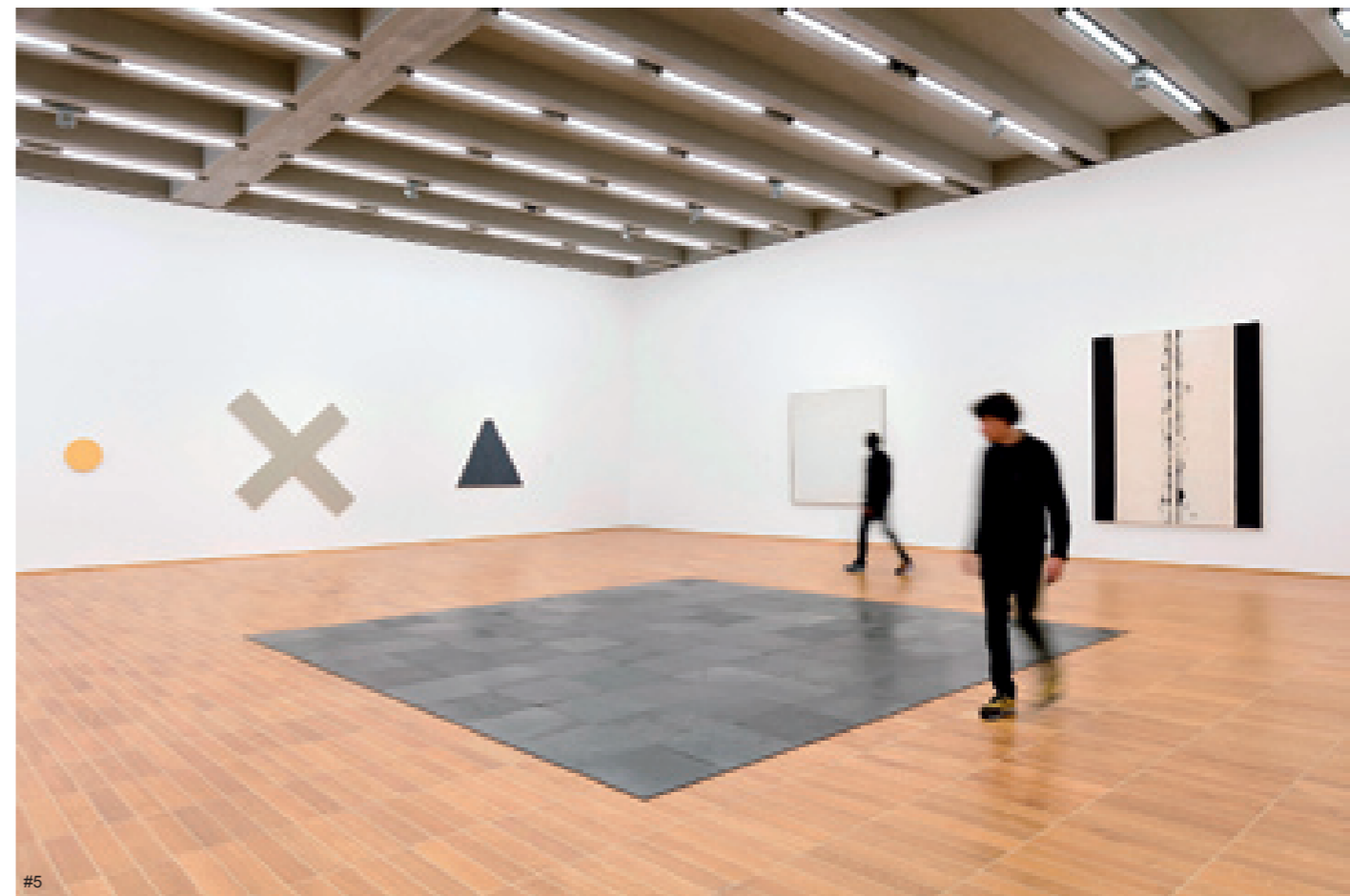
3-5 巴塞尔美术馆展厅