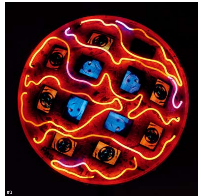
#1 当代艺术展览现场 #2 无题 综合材料 Lee Bontecon #3 无气 装置、影像 Nam June Paik