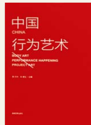
中国行为艺术 主编：贾方舟 朱青生

出版发行：四季出版有限公司 执行主编：段君 执行副主编：滕宇宁 责任编辑：之之、邵浩 开本：1/16 出版时间：2015年7月 定价：158元