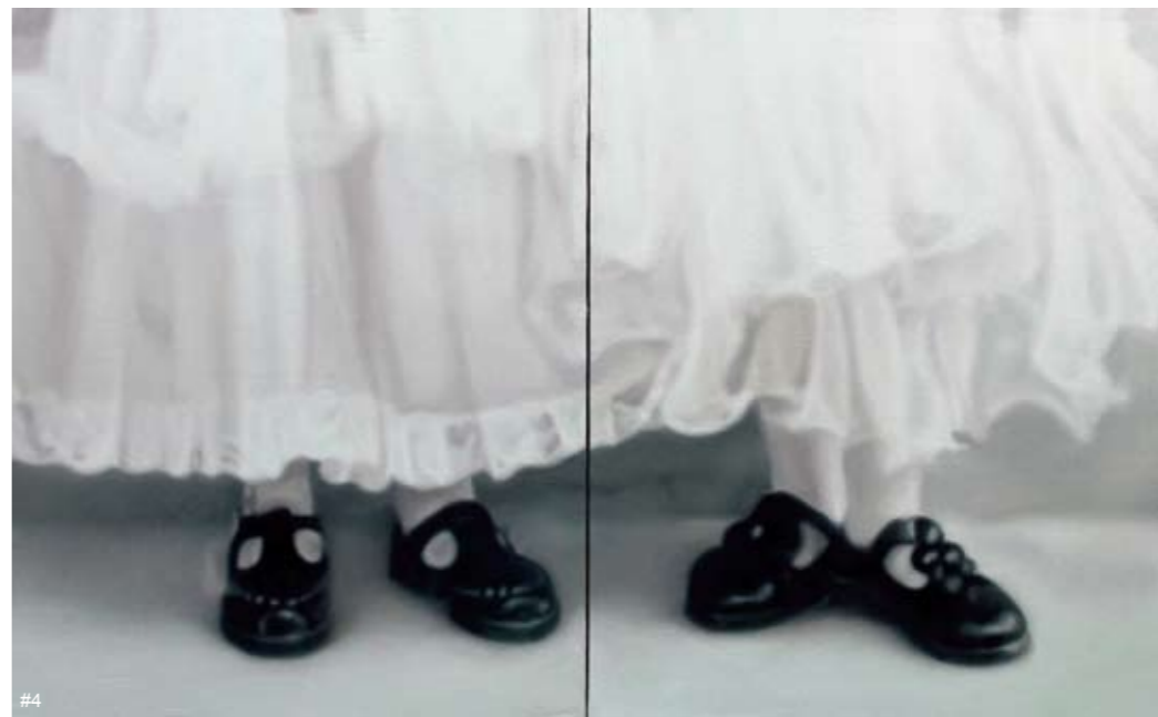
4 陈少锦 小皮鞋 布面油画 130cm × 80cm 四川美术学院油画系第26届学生作品年展 二等奖作品

是本科的课堂教学面临非常大的挑战。教学的吸引力在哪？学生获得信息、资讯，甚至图像经验的方式，都不再只是来自于课堂或者教师。相对来说，每位教师都是片面和局部的，而在今天这种信息传播的方式下，我们每天面临大量碎片式的图像信息和关于艺术热点的讨论。任何一位敏锐的艺术家，都能很快获得自媒体或电子媒体传播的最新信息、图像和艺术前沿资讯，这些信息的网络传播速度远远超过传统方式——经过学院、老师整理消化后，形成系统的知识体系传播给学生的速度。因此，教师传统的教学方式在当下面临非常严峻的考验。今天的课程内容以及教师对学生的创作、对学习的刺激和有效性在哪里？知识体系是不是滞后的？今天的课堂对学生的吸引力一定来源于教师，教师必须不断地扩充知识宽度，提升经验值，并快速有效地转化为教学资源；另外还要通过经验有效地找到学生自身的创作和当下资讯的结合点。我认为这是老师的价值所在，也是老师判断力的体现——如何用自己的经验对学生的艺术训练、创作指导甚至作品的呈现做出引导。