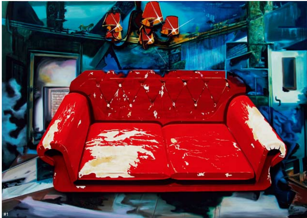
1 王金博 咖啡洒了 布面油画、聚苯乙烯 150cm × 200cm 四川美术学院油画系第26届学生作品年展一等奖作品