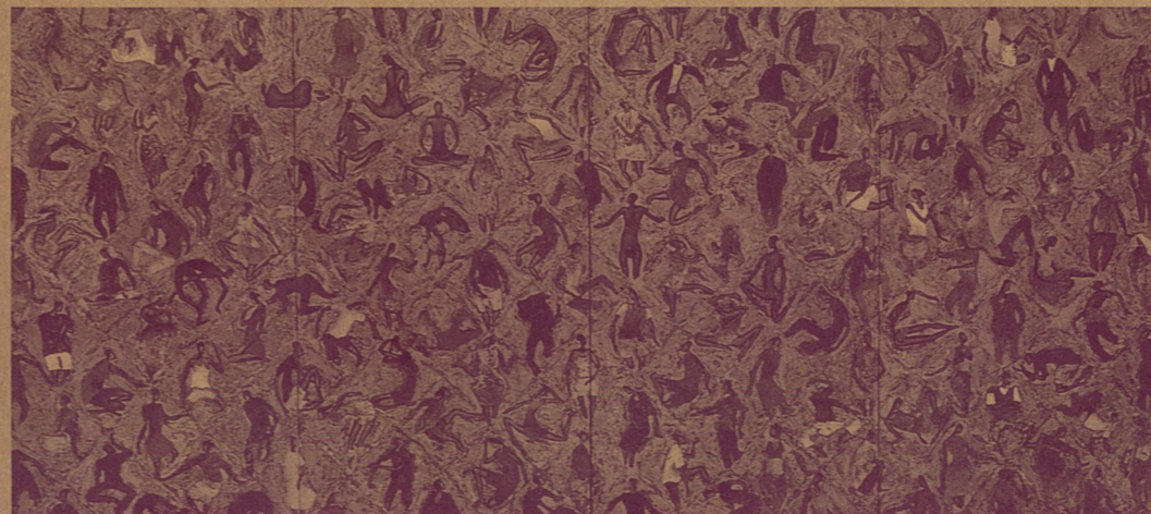
《人世百态》 宋完根(韩国研究生) 漆画 110 × 240cm

同文化的差异，我们的教育方法和手段，远远不能适应各国留学生对我们的教育的期望和各种不同的要求。教学手段的单一和种种教学设施的落后，也给留学生教育带来了许多困难，加之语言上的障碍，给沟通和传授造成了诸多不便。特别是留学生教育是一种特殊的教育，它不可能有很大的规模和统一的班级，一般只能插班就读，这给教师教学带来一些难度，也给管理工作提出了新的要求。