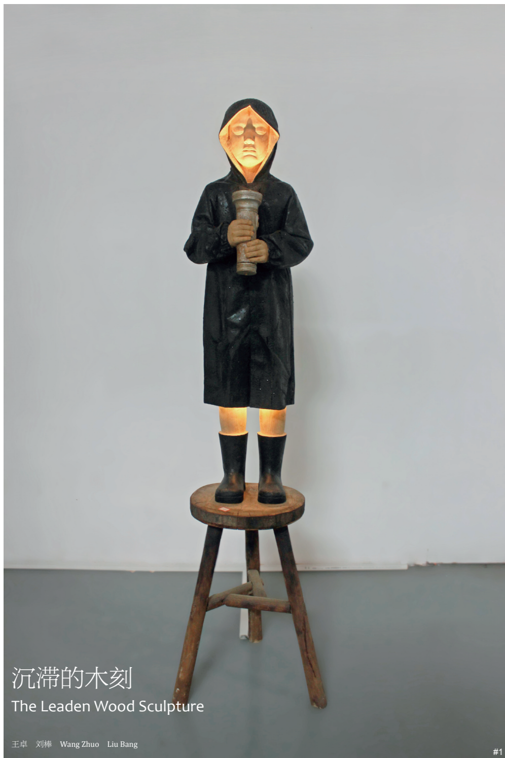
沉滞的木刻 The Leaden Wood Sculpture