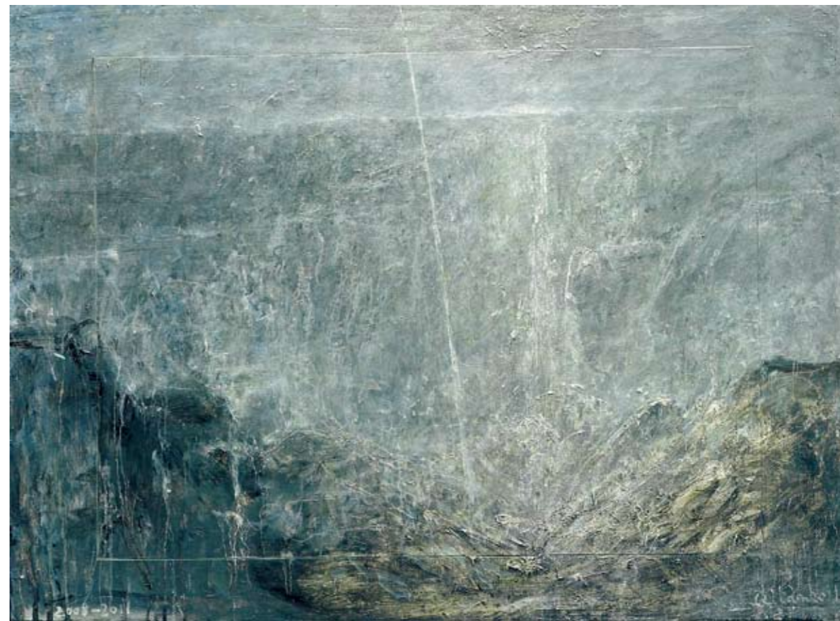
高山流水 木板油彩 80×107cm 2008—2011年 漆澜

面向未来的想象，最终还是指向我们自身，激荡起一种自我批评的力量，以揭开遮蔽当代的迷雾，并在历史的客观性追求中挖掘出内在的艺术和社会危机，从而生发与未来接轨的精神通道。