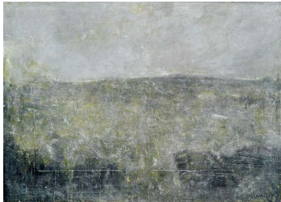
复调的风景 木板油彩 81×112cm 2007—2011年 漆澜