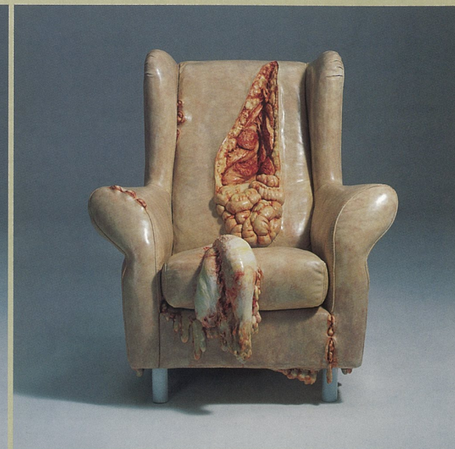
可视的体温之二 树脂、纤维等综合材料 曹晖