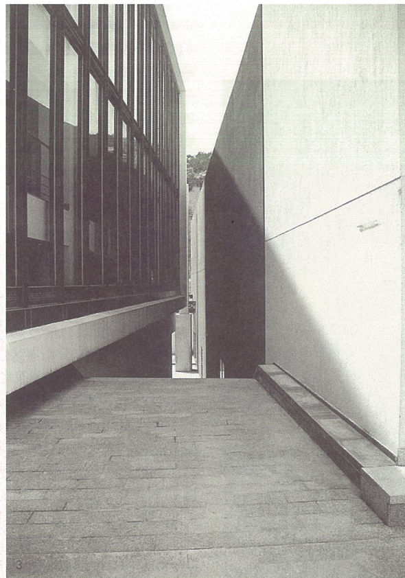
1-4. 苏州大学文正学院图书馆

王 ：建筑艺术的一个基本特点，就是出一个作品的周期很长，而且不容易坚持到底。我现在除了想如何办好建筑系，就是想如何把已经在做的建筑做好，不放过任何一个细节，甚至为此可以暂时不做新的项目。除此之外，如何不重复自己，始终是一个问题。