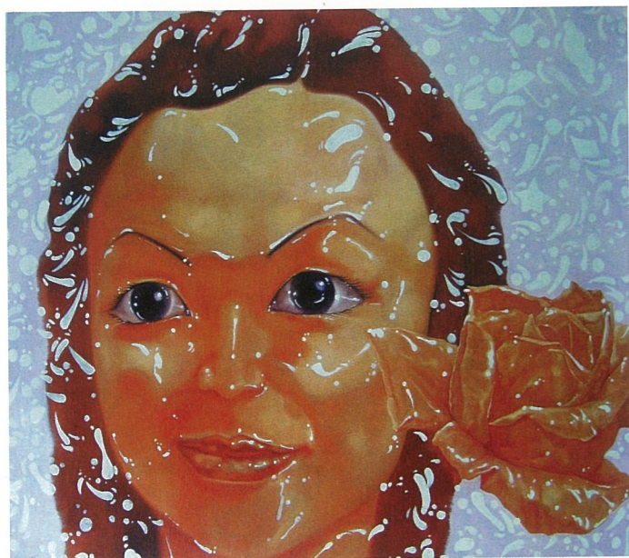
角色 NO.5 油画 孙晓枫