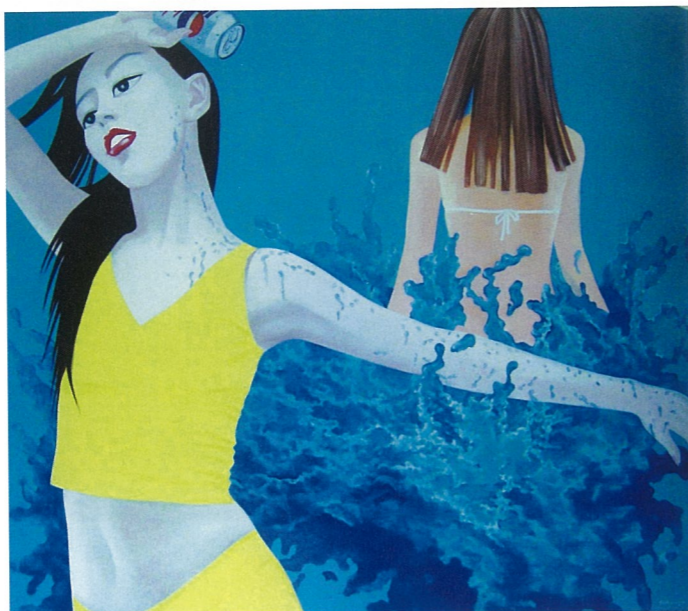
浪花 油画 杨帆